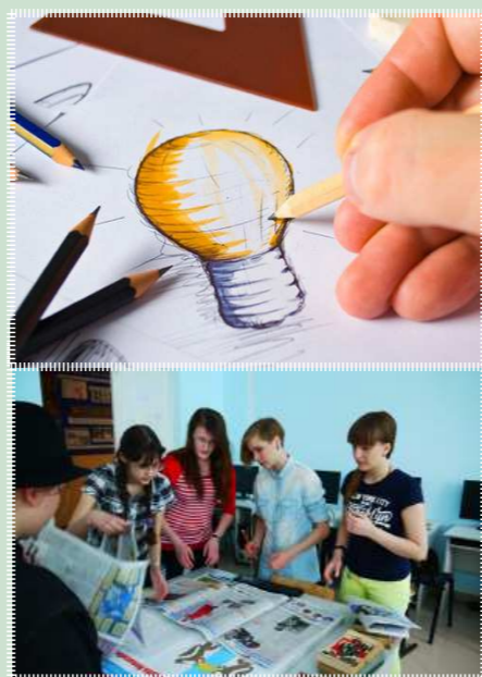
Подготовила: Матузова Виктория

За прошедший учебный год первокурсники освоили азы профессии. Итоговое занятие показало их творческий потенциал и желание постигать профессию, искать новые пути решений, претворять свои задумки в жизнь. Студентами показано освоение нового направления в искусстве книжной скульптуры – планшетная графика. Полученные знания и навыки помогут в следующем учебном году перейти к более сложному разделу учебной программы.