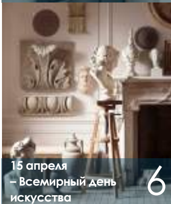
15 апреля – Всемирный день искусства