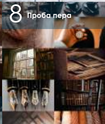
8 Проба пера

В Новосибирской области прошел XXVII региональный фестиваль «Российская студенческая весна». Творческая молодежь Новосибирской области с 31 марта по 21 апреля выступала в направлениях: «Концертные программы», «Танцевальное», «Театральное», «Журналистика», «Видео», «Инструментальное», «Оригинальный жанр», «Мода», «АРТ» и «Вокальное».