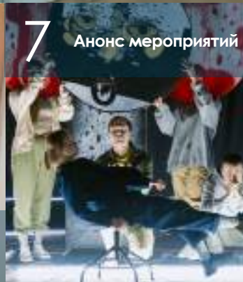
7 Анонс мероприятий