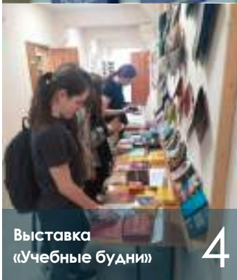
Выставка «Учебные будни»